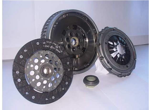
Original Kit with Dual Mass Flywheel

This clutch kit, including rigid flywheel, has been designed by Valeo engineers as a replacement to the original clutch kit & dual mass flywheel. Despite being visually different from the original clutch (including a rigid flywheel & a dampened disc instead of a dual mass flywheel & a rigid disc), Valeo guarantees that this clutch kit, if correctly installed on the vehicle, will give you full satisfaction in terms of quality, reliability & durability.