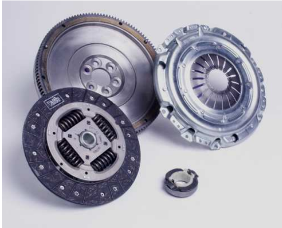
Valeo Kit 4-pcs with Rigid Flywheel

Zestaw 4-elementowy z sztywnym kołem zamachowym Rijit volan içeren 4'lü takım 4dílná spojková sada s pevným setrvačником 4-részes kuplungszett rögzített lendkerékkel Комплект сцепления с жестким маховиком Комплект 4 части с пльтен маховик Σετ 4 τεμαχίων με συμπαγές βολάν